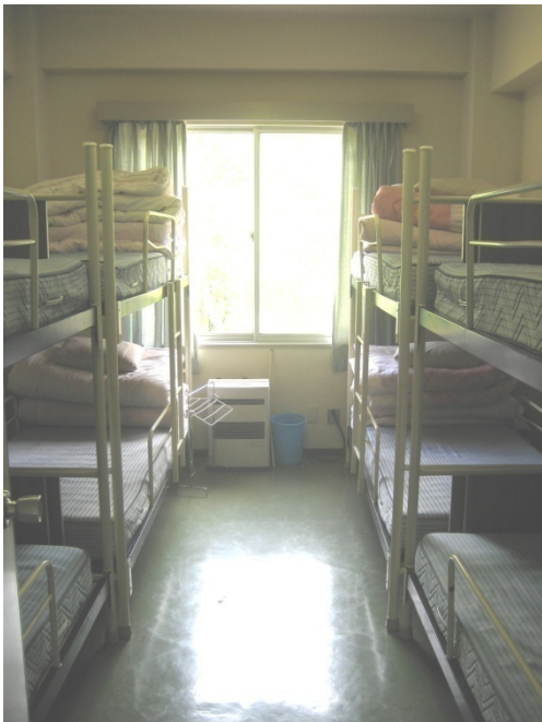
8人収容洋室が6部屋