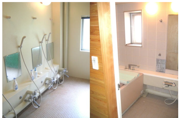
男性・女性 各浴室 有り