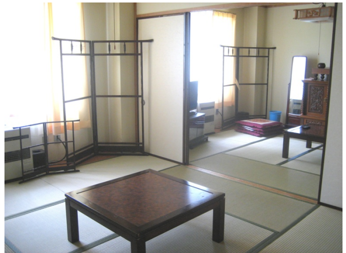
6畳和室が2部屋（二間続き）